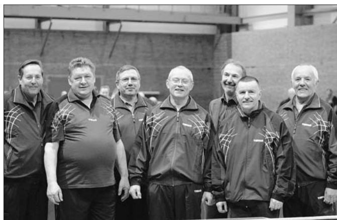
Die 6 Starter vom Heringsdorfer SV

Im Rahmen der 700-Jahr-Feier des Ostseebades Zinnowitz erhielt der Heringsdorfer SV BW 90 den Zuschlag für die Ausrichtung der Senioreneinzelmeisterschaften vom 23. bis zum 25.01.2009 in der Sportschule Zinnowitz. Gemeinsam mit der Unterstützung der Gemeinde Ostseebad Zinnowitz, der Kurverwaltung und der Sportschule Zinnowitz gelang es den Aktiven des Heringsdorfer SV Meisterschaften auszurichten, die noch lange in aller Munde bei den Teilnehmern, den Offiziellen und den Zuschauern sein werden. 158 Sportler aus 31 Vereinen nahmen an den Meisterschaften teil und boten in den Alterklassen Ü 40 bis Ü 75 einen beeindruckenden Sport. Leider konnten die Heringsdorfer Spieler nicht in die Medailenplätze eindringen.